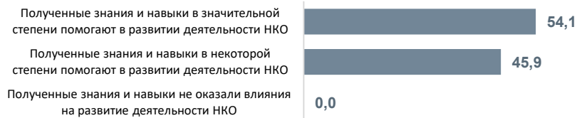
Диаграмма 8. Оценка влияния полученных знаний и навыков на развитие деятельности НКО

Полученные знания и навыки помогают в развитии деятельности НКО.