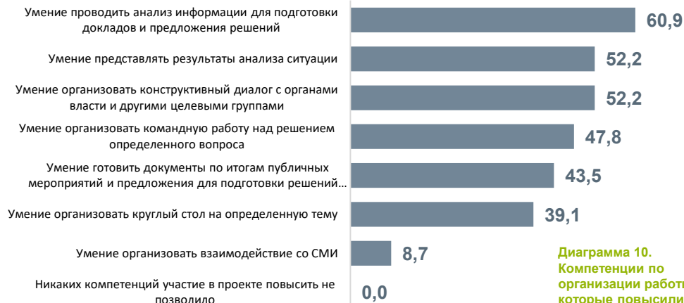
Диаграмма 10. Компетенции по организации работы в ОС, которые повысили участники проекта