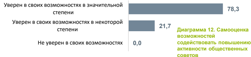
Диаграмма 12. Самооценка возможностей содействовать повышению активности общественных советов

Уверенность в собственных возможностях способствовать повышению активности общественных советов продемонстрировали все участники проекта.