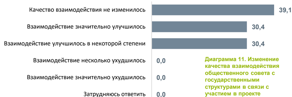
Диаграмма 11. Изменение качества взаимодействия общественного совета с государственными структурами в связи с участием в проекте

Ухудшения качества взаимодействия не произошло.