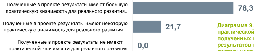
Диаграмма 9. Оценка практической значимости полученных в проекте результатов на развитие деятельности ОС

Полученные членами общественных советов результаты имеют практическую значимость для развития деятельности общественных советов